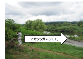
図2 アカツツガムシの生息する河川敷 (矢印より川に近い水際に生息域)