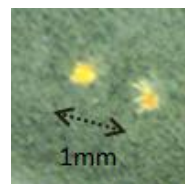
図1 アカツツガムシ幼虫 (2匹; 体長 約 0.2mm)

すぐに洗濯できない時は、衣類をビニール袋に密閉しておいても良いでしょう。また1)~3)に加えて、効能書きに「ツツガムシ」と記載のある虫除けスプレーを使うことも有効です。それでも発熱などの症状が現れた場合は、すぐに受診しましょう。その際、河川敷での活動があったことを医師に伝えることが重要です。