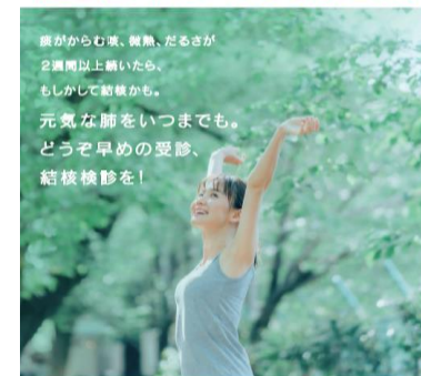
日本は、まだ年1万人以上が結核に罹患する「中まん延国」です。